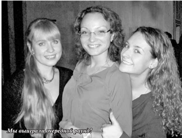
Мы выиграли очередной раунд!

участника, но и функции мудрого тренера-наставника по праву и корректора позиций. Собственным примером усердия и самоотдачи она стимулировала работу остальных участников.