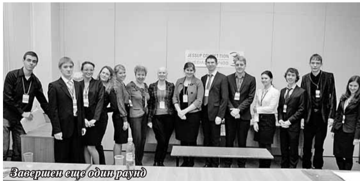
Завершен еще один раунд