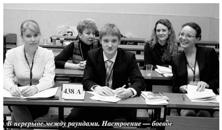
В перерыве между раундами. Настроение — боевое

Оказалось, однако, что и четвертый год откроет для меня новое требование, точнее, новую