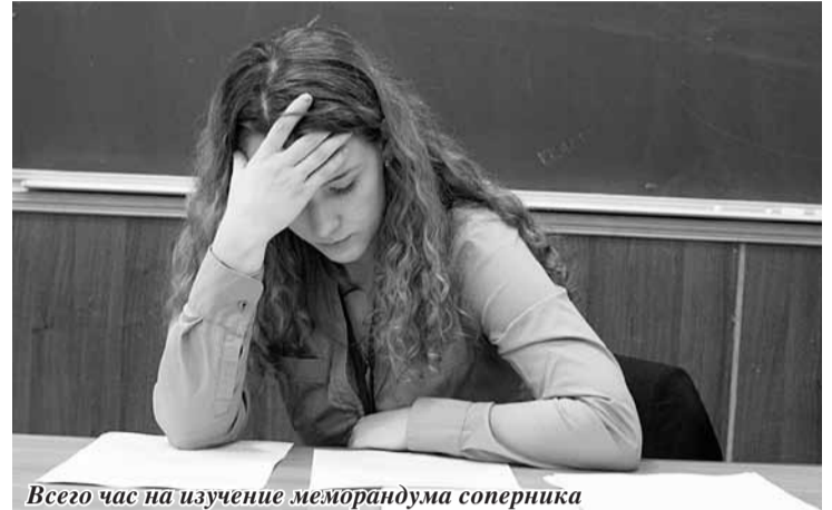
Всего час на изучение меморандума соперника

Джессоп — это маленькая жизнь, зарождающаяся каждый год в начале осени вместе с выходом Compromis, жизнь семьи, в которой действуют свои правила и ради которой приходится много чем жертвовать, вносить свой собственный вклад. Здесь не обойтись без помощи «старейших». Только они знают на собственном опыте обо всех тонкостях конкурса, секретах успешного написания меморандума и выступления. Вероятность войти в десять лучших команд, имея в составе команды только новых участников и не прибегая к помощи участников прошлых лет, практически равна