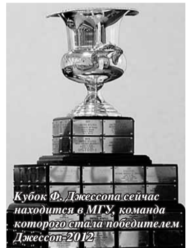
Кубок Ф. Джессопа сейчас находится в МГУ, команда которого стала победителем Джессоп-2012