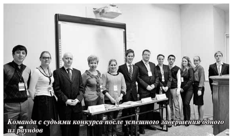
Команда с судьями конкурса после успешного завершения одного из раундов

позволило бы нам попасть в топ 16 и стать одной из трех лучших Российских команд в истории Джессопа. Команда действительно великолепна, и все возможно, но многое зависит от удачи, в частности, от того, с кем мы столкнемся на предварительном этапе, какие нам попадутся судьи в определенных решающих раундах и многого другого. Но лишь немного везения, и топ 16 становится вполне реальным результатом!