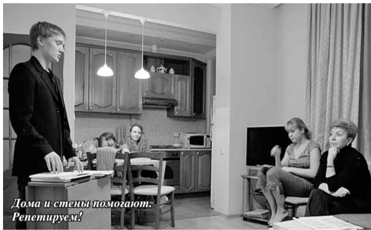
Дома и стены помогают. Репетируем!